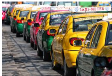
Taxis à Bangkok

Petit déjeuner à l'hôtel Selon l'horaire de votre vol retour : libération de la chambre, matinée et/ou après-midi libre Taxi pour rejoindre l'aéroport de Bangkok Suvarnabhumi Notre prestation prend fin à l'arrivée à l'aéroport avant votre vol départ de Bangkok