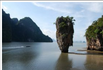
Baie de Phang Nga James Bond Island

Journée d'excursion dans la baie de Phang Nga et ses plages, lagons et pitons calcaires : James Bond Island, Phi Phi Lee (Maya Bay, film "La Plage"), village flottant de Ko Panyi, etc... Nuit à Phuket