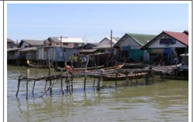
Village flottant Koh Panyi