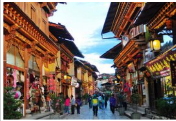
Chiang Mai Vieille ville

Départ tôt le matin en bus de Sukhotai vers Chiang Mai (durée : 6h00 env.) Installation à l'hôtel sélectionné à Chiang Mai Visite de Chiang Mai Nuit à Chiang Mai