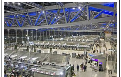
Aéroport Bangkok Suvarnabhumi