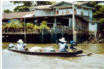
Klongs à Bangkok

Arrivée de votre vol international à l'aéroport de Bangkok Suvarnabhumi Taxi ou transport en commun pour rejoindre l'hôtel sélectionné à Bangkok Visites l'après-midi (ballade sur les klongs) Marché de nuit à partir de la fin d'après midi Nuit à Bangkok