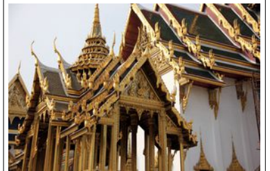
Bangkok Grand Palais