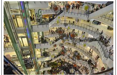
Shopping à Bangkok