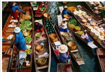
Marché flottant Damnoen

Marché flottant : Damnoen Saduak Market (touristique et fréquenté) ou Amphawa (plus petit mais plus authentique) Maklong Railway Market : un train au milieu du marché Visite de Bangkok : Grand Palais – Temple du Bouddha d'Emeraude : Nuit à Bangkok