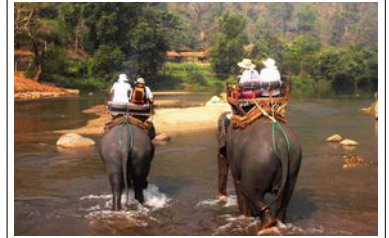
Chiang Mai Camp d'éléphants