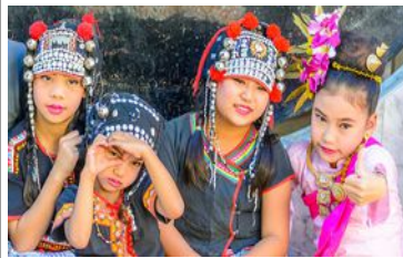
Tribu dans les montagnes

Excursion dans les montagnes Rencontre de tribus Trekking facile Descente de rivière en radeau en bambou Nuit à Chiang Mai