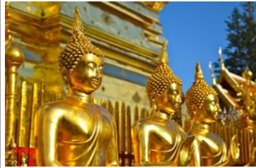
Chiang Mai Temple Doi Suthep

Visite du temple Doi Suthep Visite d'un camp d'éléphants, journée ou demi-journée pour s'occuper des éléphants : nourriture, bain, balade, etc. Nuit à Chiang Mai