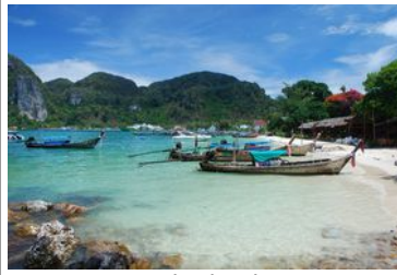
Koh Phi Phi

Journée sur l'île de Koh Phi Phi Récupération des bagages à l'hôtel en fin d'après midi Bus VIP de nuit de Phuket à Bangkok Nuit dans le bus (durée : environ 11 à 12h)