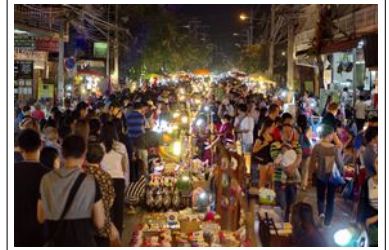
Chiang Mai Marché de nuit