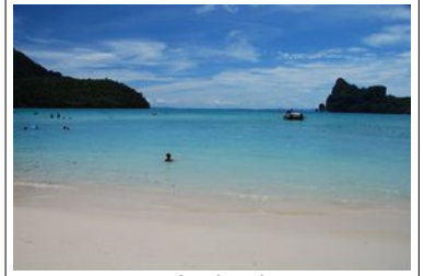
Koh Phi Phi