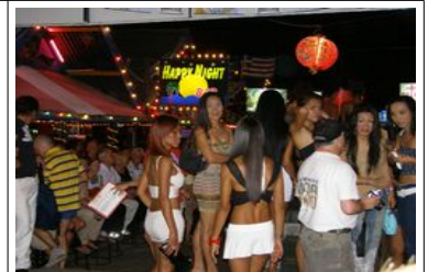
Vie nocturne à Phuket