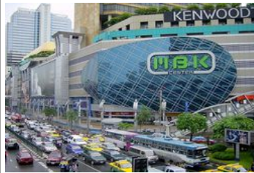
Shopping à Bangkok

Arrivée à Bangkok tôt le matin Installation à l'hôtel sélectionné à Bangkok Journée libre, notamment pour le shopping dans les grands centres commerciaux Nuit à Bangkok